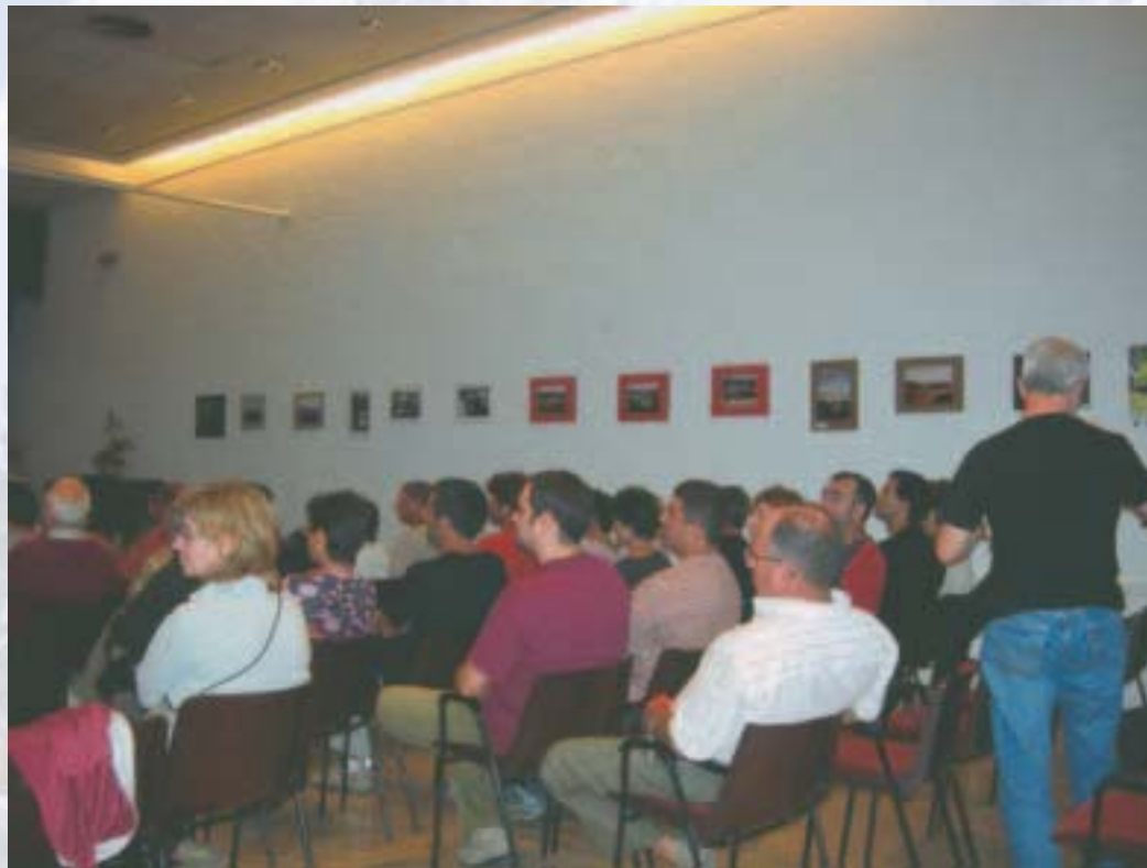
Exposició de les fotografies del concurs a la sala d'actes del Club Pollença