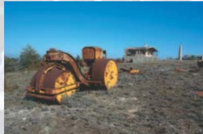
Els Motllats. Serra de Prades

Una de les accions sobre instal·lacions obsoletes que més ressò internacional ha tingut, va començar durant l'estiu de 1992 quan Mountain Wilderness d'Itàlia va iniciar la pressió –amb diverses manifestacions i molts altres actes– per aconseguir el desmuntatge d'un espectacular repetidor de ràdio abandonat sobre l'Agulla de Tré-la-Tête, a 3.920 metres d'alçada. Finalment, el setembre del 2002 es retira aquesta instal·lació amb un cost de desmuntatge de 41.000 euros, finançat íntegrament pel govern regional de la vall d'Aosta.