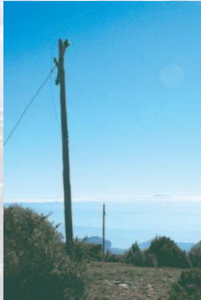
Pals telefònics. Serra d'Aubeng

Us animem a entrar en l'apartat d'instal·lacions obsoletes del web i omplir en l'espai de formulari / fitxa la informació que tingueu de qualsevol element abandonat o instal·lació obsoleta per incorporar a la base de dades. Aquesta fitxa inclou diversos apartats sobre la situació, localització amb GPS, materials utilitzats en la seva construcció, antics responsables i actuals propietaris, valor històric o arqueològic que pugui tenir, etc. juntament amb material gràfic per completar la seva catalogació. Feu-ne també la màxima difusió!!!