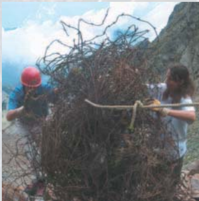
MW França. Mercantour

Hi ha molta feina per fer, i per això fem una crida als excursionistes per tal que puguin col·laborar a fer propostes d'actuació que portin a eliminar-les o reutilitzar-les en benefici de la qualitat paisatgística i de la millora dels entorns muntanyencs. Les muntanyes són un espai fràgil que hem de conservar i -malauradament- ja sofreixen massa intervencions forçades pel progrés de la humanitat (carreteres, túnels, antenes, construccions, cables, embassaments, pistes d'esquí, mines...). Quan aquestes instal·lacions deixen de tenir l'ús per les quals s'han muntat, estan obsoletes. També hi ha elements abandonats a la muntanya que cal indexar, documentar i retirar (avionetes o peces pesades, vehicles, ferralla, estaques...)