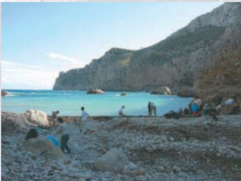
Acció de neteja a cota zero