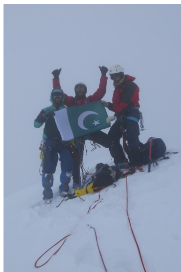
Aspirants a guia celebren la primera al Thalo zom (6.050m)

Així s'arriba a la campanya del 2019 que afegí l'objectiu d'estudiar i perfilar possibles itineraris, adequats per a excursions i travesses dins la