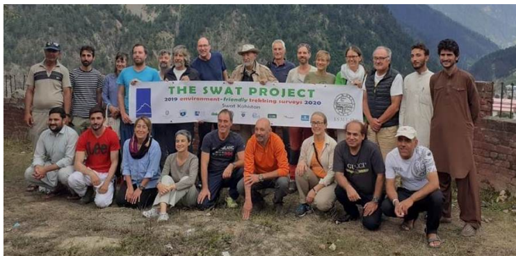
Membres de la campanya SwatProject 2019

La vall del riu Swat, a la província de Khyber Pakhtunkhwa (Pakistan), està habitada en gran part pel poble paixtu, excepte en les parts més altes de la vall, on predomina el poble kohistaní.